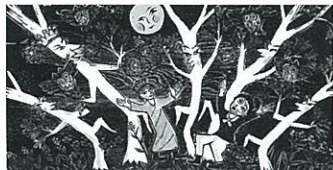
《かしわばやしの夜(踊り) 2013》