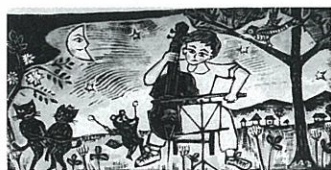
《セロ弾きのゴーシュ・合奏 2009》