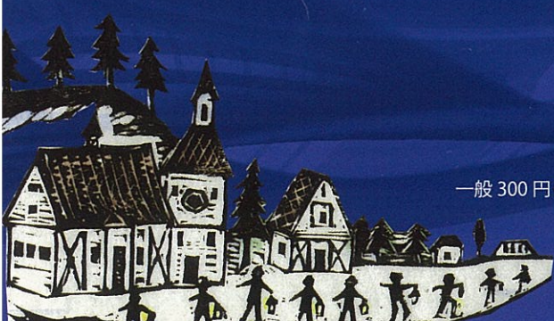
《銀河鉄道の夜・ベガス 2013》(部分)

http://www.city.tomakomai.hokkaido.jp/hakubutsukan/