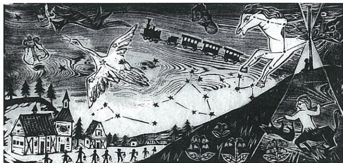
《銀河鉄道の夜・ペガサス 2013》